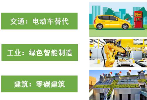
清洁电能成为最主要的能源利用形式